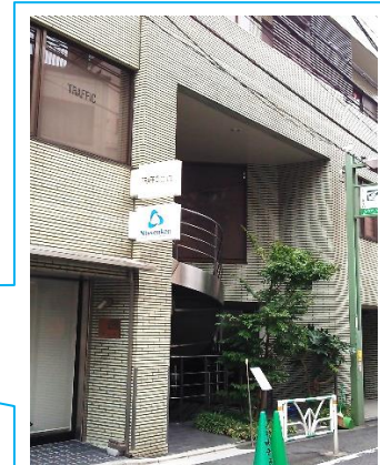
ヴィラすゞ木 地下1階

千駄ヶ谷駅を背にして、南方向へ直進。2つ目の信号を左折して100mくらい。左側のグリーンビルの地下1階(螺旋階段を下りる)。