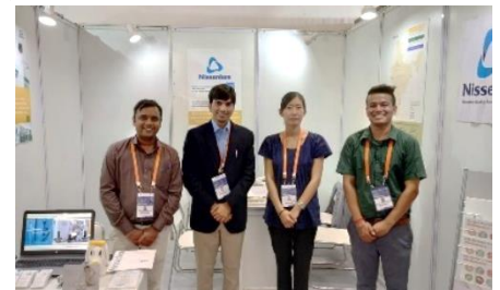
インド現地から情報を発信

世界各国から600人以上のバイヤーと294の出展社が集い、会場は賑わいを見せました。ニッセンケンブースでは、連日多くのお客様を迎え、試験やQCS(品質コンサルティング)のノウハウのほか、エコテックス®認証取得のためのサポートなど多岐に渡って事業内容をご案内しました。