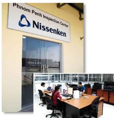
カンボジア / プノンペン支所 (プノンペン検品センター内)