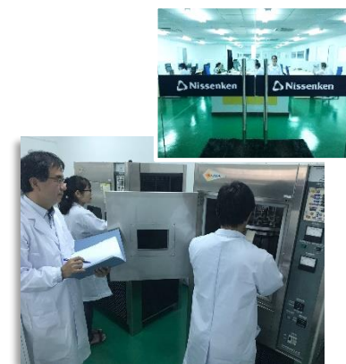
ベトナム / ホーチミン試験センター

ニッセンケンは、カンボジアでの製品づくりの品質管理をお手伝いするため、 試験受付窓口 である プノンペン支所を開設 いたしました。