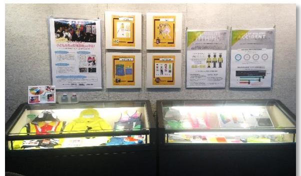
学生の皆さんの作品、デザイン画 10 点等を展示しています

一般的に道路作業者が着用する安全服は、ドライバーからよく見えることを第一義に、JIS等に定められた規格・基準に基づいた厳密なデザインが施されています。今回制作した作品は、安全性に加えファッション面での多様性も取り入れたものとなっています。本展示を通じ、子ども・児童の高視認性安全服着用が、交通事故予防の観点でいかに大事であるかが、広く社会に伝われば幸いです。ぜひ会期中に主婦会館にお越しいただきまして、学生の皆さんの作品をご覧ください!!