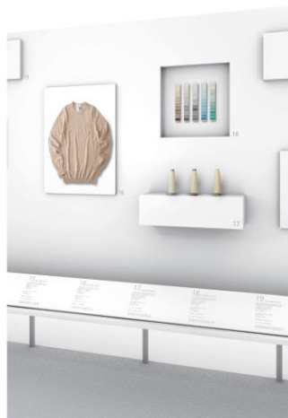
コーナーイメージ