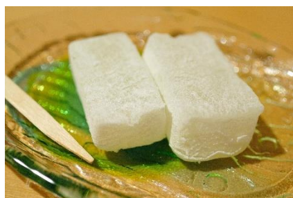
福井銘菓・羽二重餅

今回のテーマは日本が誇る絹織物の“羽二重(はぶたえ)”の名称は織物と福井銘菓の和菓子と同時期から使われてたというお話です。どうでもいいような題材ですが、思いつきラボらしいテーマなので取りあげたいと思います。北陸地域も昔から越前若狭地方では養蚕絹織物の盛んな土地で90年代には朝廷への貢献物として絹織物が使われてたという歴史書への記述も残っているとのことから羽二重組織の絹織物があっても不思議ではないのですが“羽二重”という名称は明治に入ってからのもらしいのです。