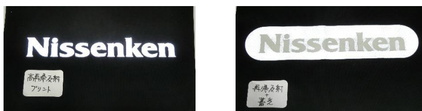
高再帰反射 (右)・高再帰反射+蓄光 (左) (今回は残念ながらランキング外でした)

反射のプリント手順は 生地に接着させるバインダー層があってその上に光が逃げないように隠蔽層(いんぺいそう)を引きその上に色をのせて(今回のサンプルはブルー)その上に反射シートをのせてつくりますが 何層も重ねて各層がそれぞれの役割を果たすので再帰反射プリントがつくれるのです。今回は直接生地に塗りこんだのではなく いちど転写紙に印刷したものを転写するという方法でつくりました。