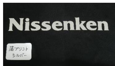
箔プリント ゴールド(右)・シルバー(左)