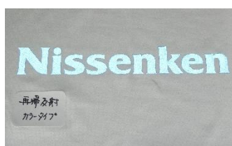
再帰反射プリント カラータイプ