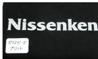
ガラスビーズ プリント