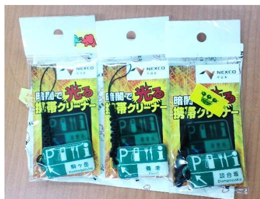
蓄光素材を含むグッズ

などの規格があります。蓄光商品の光るしくみに興味がなくとも蓄光商品に興味を持っていた だけでそれで充分です。防災・安全グッズだけでなくファンシー雑貨や印刷類にも蓄光原料 は使用されていますので気になる方は探してみてください。